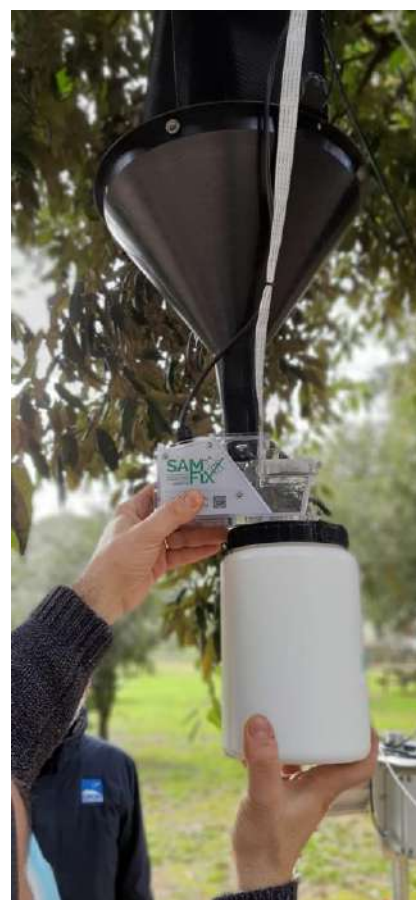
Figura 6. X-Trap

La piattaforma fornisce informazioni sugli impatti dell'invasione di specie di Xylosandrus nelle aree monitorate, e mostra i risultati delle attività di monitoraggio, mitigazione e comunicazione implementate dai partners.