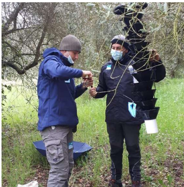
Figura 4b. Installazione trappola multifunnel al Circeo

Le reti di trappolamento sono state installate nel Parco nazionale del Circeo e nelle aree limitrofe, in e attorno al El Tello (Spagna), a Mont Boron, Sain-Jean-Cap-Ferrat, ai confini di Corniche de la Riviera, in Villa Thuret e Bois de la Garoupe ad Antibes e nell'Isola di San Margherita (Francia). Al fine di assicurare un controllo più capillare possibile nelle aree coinvolte, sono state portate avanti attività di sorveglianza intensiva con la collaborazione di altri stakeholders (tra cui vivai, carabinieri forestali, gestori dei parchi), effettuando ispezioni su piante potenzialmente infette e verificandone i danni. Essi sono