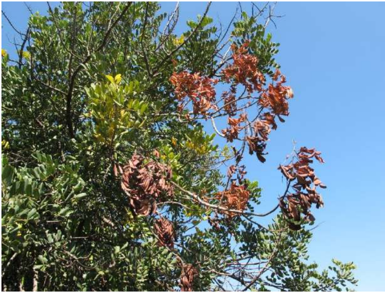
Figura 1. Rami essiccati in seguito agli attacchi di Xylosandrus