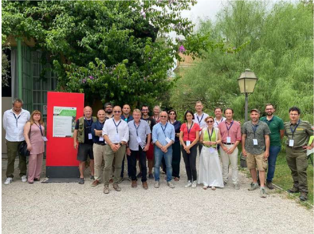
Figura 7. LIFE SAMFIX team

18 articoli tecnici e scientifici sono stati pubblicati su giornali nazionali e internazionali. Sono stati organizzati svariati eventi formativi, mirati a specifici gruppi di interessati (personale dei parchi, vivaisti e giardinieri, etc.) e sono stati messi a disposizione sul sito di progetto una varietà di materiali per facilitare la replica delle buone pratiche in altre aree che potrebbero averne bisogno.