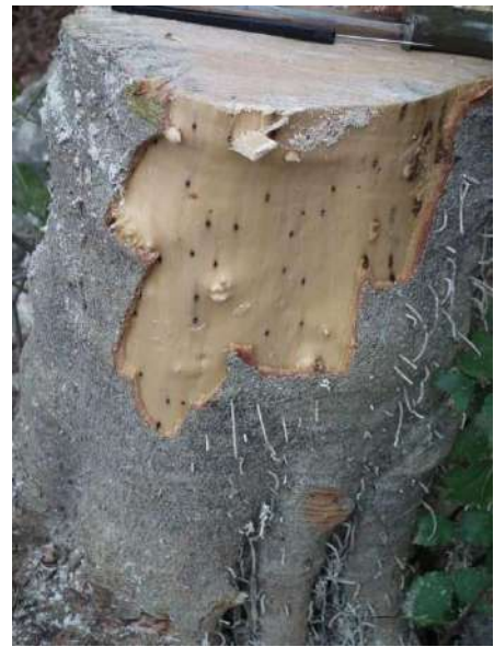
Figura 2. Danni causati da X. crassiusculus

Questi scolitidi, che ospitano funghi simbiotici, scavano gallerie in rami giovani ( X. compactus ) e tronchi ( X. crassiusculus ) di alberi. Gli alberi infestati possono mostrare avvizzimento, deformazione del ramo, rotture e deperimento generale.