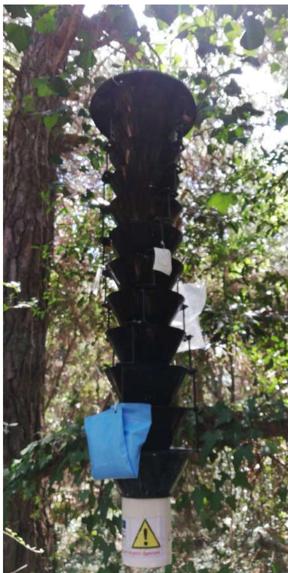
Figura 4a Trappola multifunnel con attrattore al Circeo

Sono stati sperimentati anche due protocolli con l'obiettivo di contenere la presenza dei Xylosandrus : il Push&Pull e il trappolamento massiccio, che necessitano ancora di ulteriori sperimentazioni (fig. 4a, 4b).