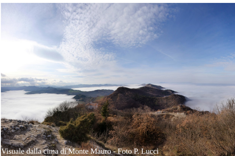
Visuale dalla cima di Monte Mauro