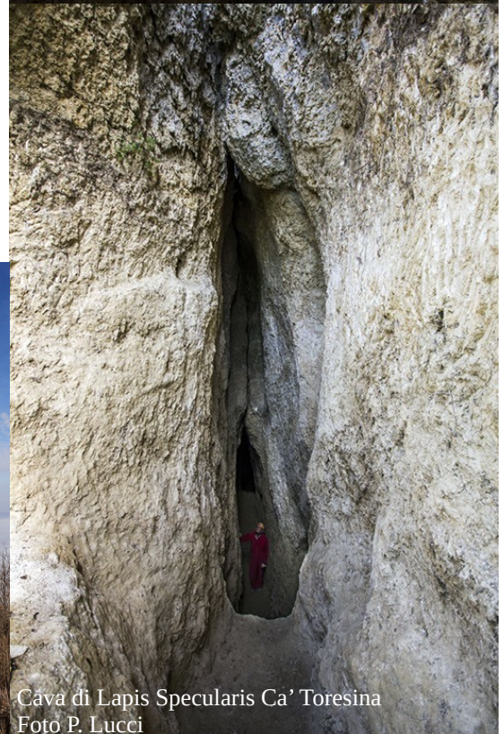
Cava di Lapis Specularis Ca' Toresina