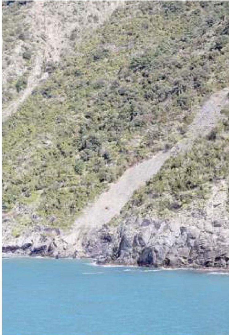
Una delle frane che ha interrotto il sentiero Manarola-Corniglia

non è nostra e la zona è privata, quindi aspettiamo un piano con il quale ci dicano come si dovrà intervenire, perché bonificare e rimettere in sicurezza l'area è priorità di tutti».