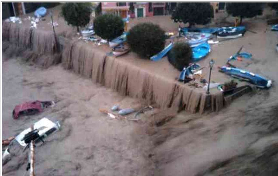
Vernazza durante l'alluvione

Sono passati già 5 anni, era infatti il 25 ottobre del 2011 quando le Cinque Terre e la Val di Vara vennero colpite dalla più devastante alluvione da molti decenni a questa parte. A Genova era una giornata fredda con forte tramontana, e proprio la convergenza tra i venti di tramontana e quelli di scirocco fece da innesco alle violentissime piogge temporalesche che per varie ore si accanirono sul territorio del Levante Ligure. Ma venne colpita anche la Toscana nella zona della Lunigiana, al confine con la Liguria.