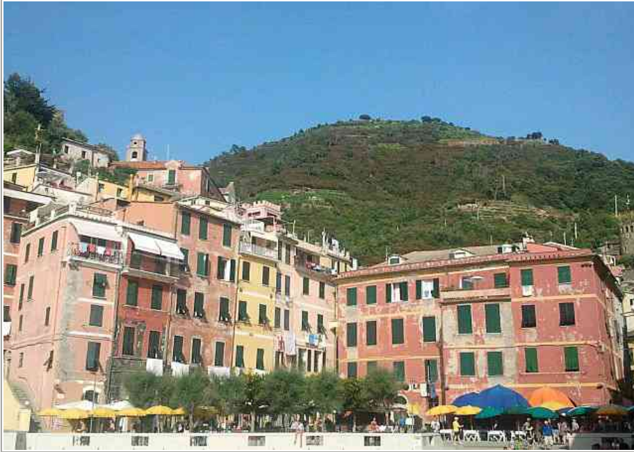
Vernazza in un pomeriggio dell'ultima estate

MeteoSardegna CAGLIARI: tempesta di fulmini e nubifragio. Forti raffiche di vento generate dal super temporale