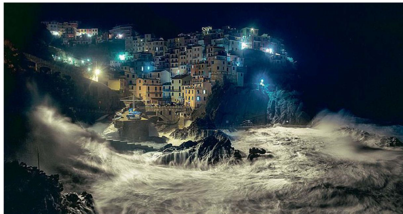
Lo scatto di Manarola che ha ottenuto il riconoscimento del National Geographic immortalata la potenza delle onde contro la scogliera