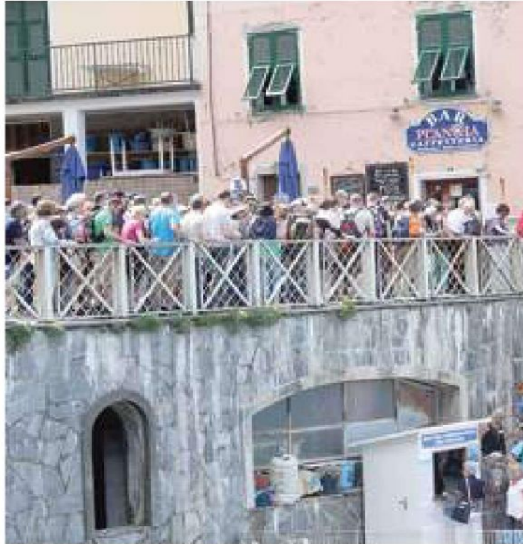
Il borgo di Manarola assediato dai turisti