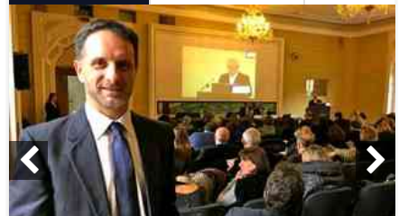
Congresso Interregionale Ligure-Piemontese SIPAD – SLC