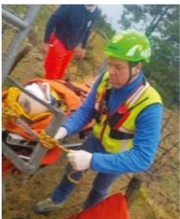
Uno dei soccorritori intervenuti per il recupero del ferito

L'sos è stato lanciato dal ferito stesso e raccolto da parenti e amici