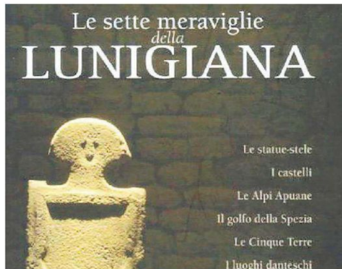
La copertina del volume sulla Lunigiana

nuguerra ricorda come la memoria del sommo poeta sia, ancor oggi, fortemente presente in Lunigiana. Nell'elegante volume, arricchito da numerose suggestive fotografie di Walter Massari , compare anche lo scritto di Elisabetta Carpiteli .