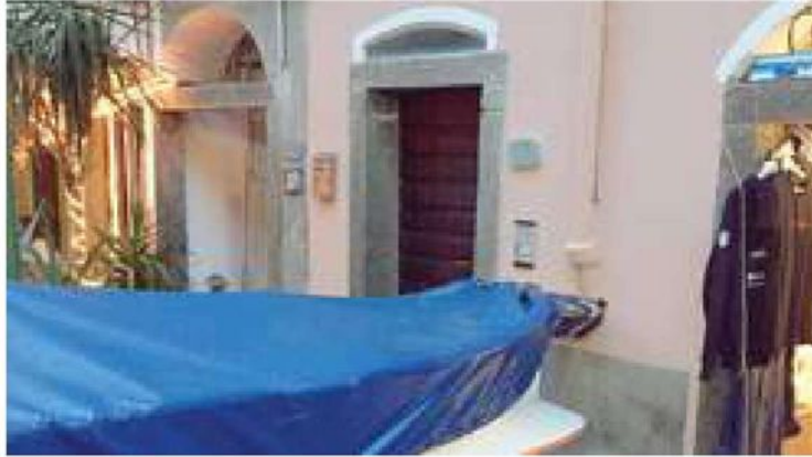
Manarola: la prua del gozzo ostacola l'uso del citofono

ne di un posto barca". Le barche lungo il caruggio che porta alla marina del borgo fanno parte della tradizione di Manarola, ma secondo i residenti della casa deve garantire una giusta convivenza con chi vive lungo la strada.