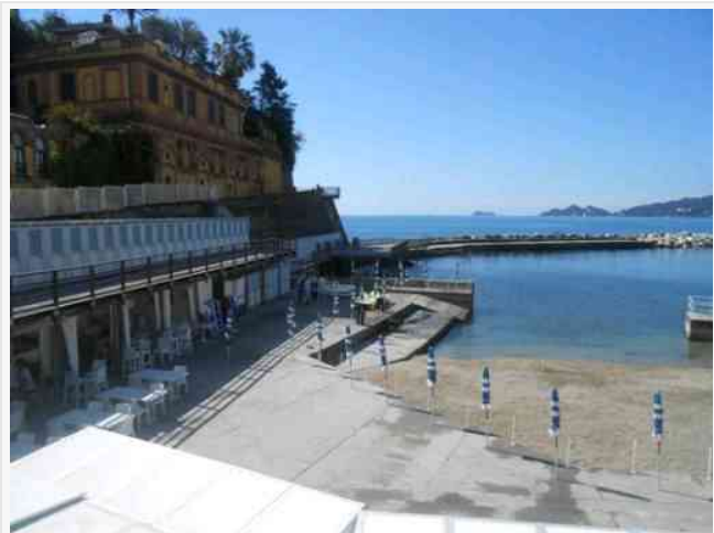
I bagni Porticciolo di Rapallo