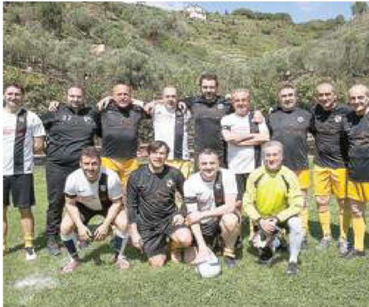
Le squadre di calcio che si sono divertite a Monterosso