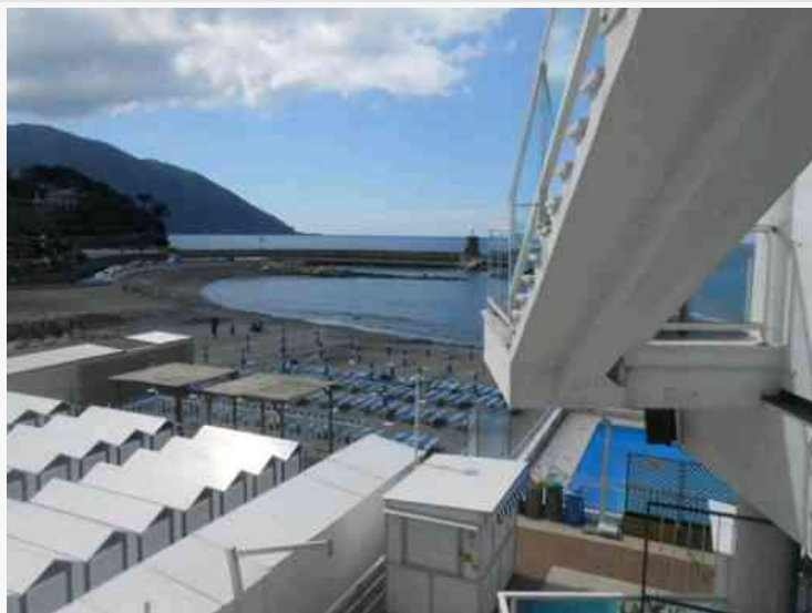
Qui siamo al Lido di Recco

Camogli, punto privilegiato di partenza per immergersi nella baia di San Fruttuoso col suo Cristo degli abissi e l'Abbazia dei Doria gestita dal Fai, è un paese incantevole, noto anche per il Festival della Comunicazione e per il suo teatro ottocentesco recentemente restaurato. I bagni "Lido" offrono tutti i servizi di un ottimo stabilimento balneare in una posizione davvero incantevole.