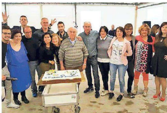
Un gruppo di volontari con la torta preparata per l'occasione