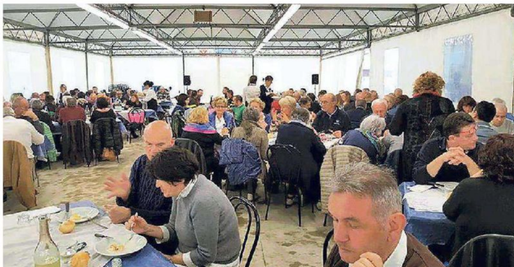
Il pranzo sociale dell'associazione, con volontari e famigliari, ieri al parco Vernazza di Calerno