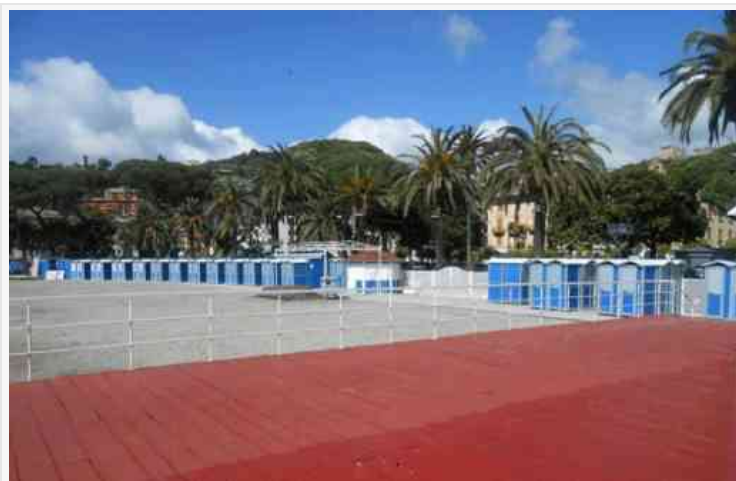
I bagni "Lido & Flora" in allestimento

L'altro stabilimento balneare di Rapallo, il "Lido & Flora", è a ponente della bellissima passeggiata a mare, in una cornice di palme, con ampie terrazze sul mare ed una larga spiaggia di sabbia. E' servito da un ampio posteggio e nella sua area interna, oltre alle cabine, offre punto di ristoro, bar. Mauro Tubino che lo gestisce spiega: "Abbiamo un parco giochi per bambini; due piscine; animazione, un ristorante ed una tavola calda capace di ospitare cento persone". Un luogo ideale per le famiglie e per stringere nuove amicizie.