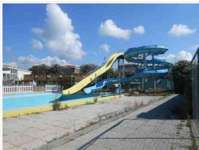
Gli scivoli e la piscina dello stabilimento Lido di Chiavari

Partiamo da Chiavari, città con un magnifico centro storico: precisamente dal "Lido", una struttura a due passi dalla riserva naturalistica della foce dell'Entella, unico fiume del Levante ricordato da Dante e frequentato da gabbiani, cormorani, aironi, germani reali e base di uccelli migratori. Simone Foppiano, che lo gestisce, è fiero anche della storia del Lido che fa parte della storia stessa della città. E poi i suoi 10.000 metri quadrati di spiaggia; i campi da calcetto e beach volley; il ping-pong ed altri giochi anche per bambini; i magnifici scivoli e la piscina; i corsi di nuoto e pallanuoto; il noleggio di canoe e pedalò; la zona fitness.