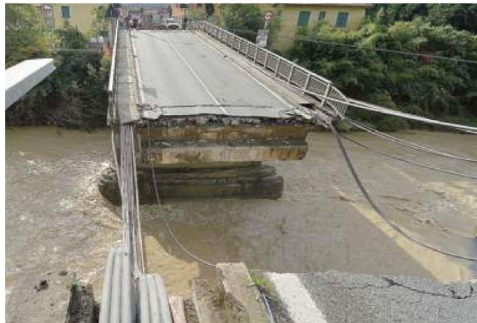
Il ponte crollato il 22 ottobre del 2013 a Carasco