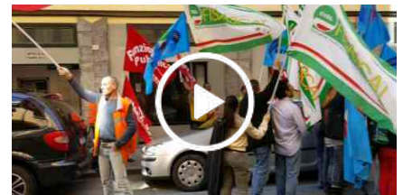
La protesta dei lavoratori della Maris sotto la sede di Acam