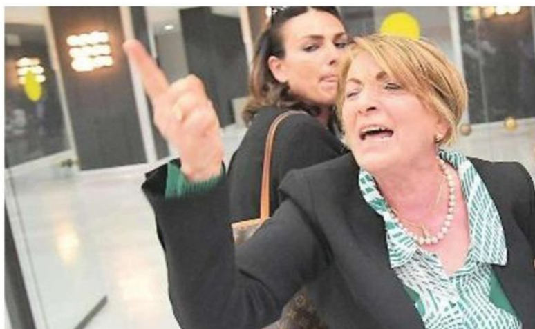
RABBIA La protesta della mamma di una vittima alla lettura della sentenza ritenuta troppo mite rispetto alle richieste della procura

Il consigliere al molo Giano per pregare dove fu recuperato il promesso sposo della figlia