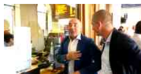
Cinque Terre Express, Berrino: "Buoni risultati senza costi per residenti"