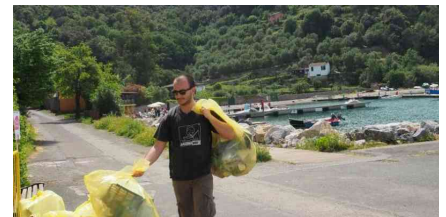
Domenica ecologica in Palmaria, un bottino di 4 quintali di rifiuti