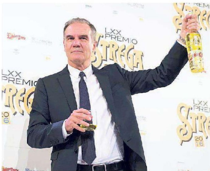
Edoardo Albinati, vincitore dello Strega 2016