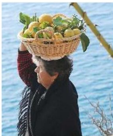
SAGRA Festa dei limoni

alle 18.30 la premiazione del limone più grande e della vetrina più bella. La manifestazione, che ogni anno registra un numero considerevole di visitatori, terminerà con la musica in piazza, dalle ore 21 in poi. Per avere informazioni sull'evento è possibile contattare la Proloco di Monterosso al numero di telefono 0187 817506, oppure scrivere una mail a infoprolocomonterosso@gmail.com .