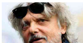
Samp, Ferrero non è più presidente