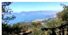
Altri due sentieri strappati dai bikers al Caprione. Su uno veglia Buck