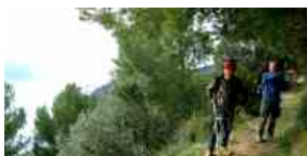
L'isola Palmaria e i suoi sentieri protagonisti in un libro