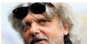
Samp, Ferrero non è più presidente