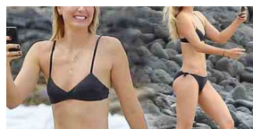
I 30 anni Sharapova: trofei, glamour e ombre doping