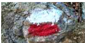
Rete sentieristica, a Riomaggiore si cercano sponsor