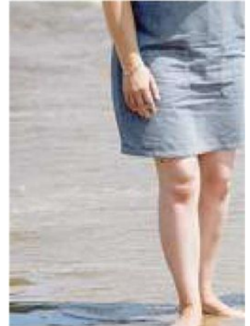
L'inquinamento dei litorali è un problema mai risolto

corata al Molo Caligoliano del porto commerciale, e sarà visibile il 30 giugno, dalle 10 alle 12 e dalle 16 alle 19, e il primo luglio, dalle 10 alle 16.