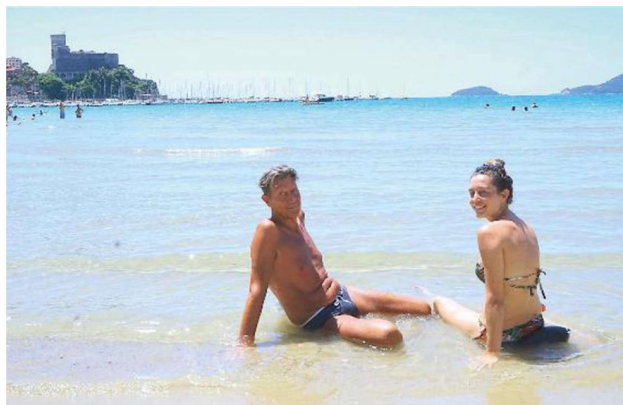
TURISMO Villeggianti in crescita sulle spiagge lericine. Il flusso di persone inizia ad aumentare già durante i primi ponti festivi (reportorio)

BUONI ANCHE I DATI DAL MONDO DEL COMMERCIO E DELLA RISTORAZIONE. SEDICI I NUOVI NEGOZI A FRONTE DI QUATTRO CHIUSURE. I NUOVI RISTORANTI SONO STATI INVECE QUATTRO E UNO SOLO CHIUSO