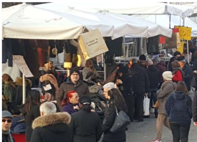
Bancarelle in Fiera nell'edizione dello scorso anno: la manifestazione inizia oggi

Coinvolti i ragazzi dell'istituto professionale «Berti» per la «Gran Gnocolada»