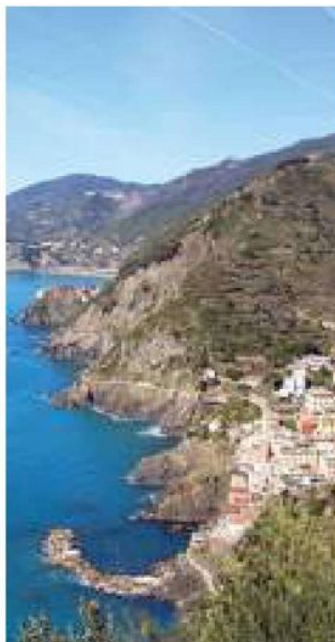
Un paradiso da "gestire"