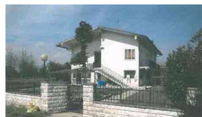
Appartamenti Campolongo Maggiore via della Libertà 2 - 70142

Vendite giudiziarie - La Nuova Venezia Tribunale di Venezia