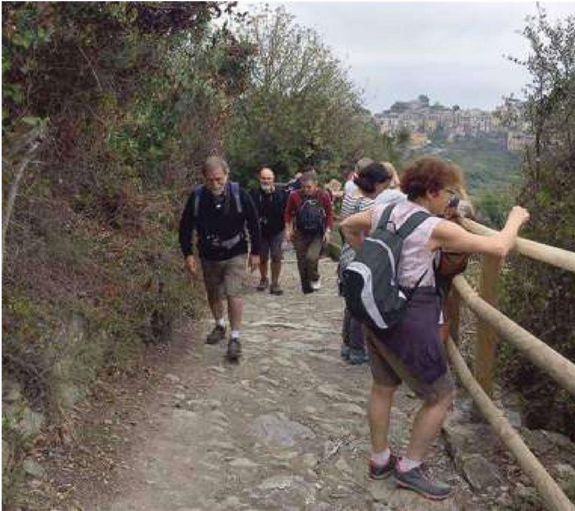
Cinque Terre: escursionisti impegnati lungo uno dei sentieri che salgono sul crinale

congestionare il fragile territorio delle Cinque Terre. Proprio come sta registrando una crescita il turismo in giornata, mordi e fuggi, stanno aumentando anche le presenze del turismo amante del trekking e della natura.