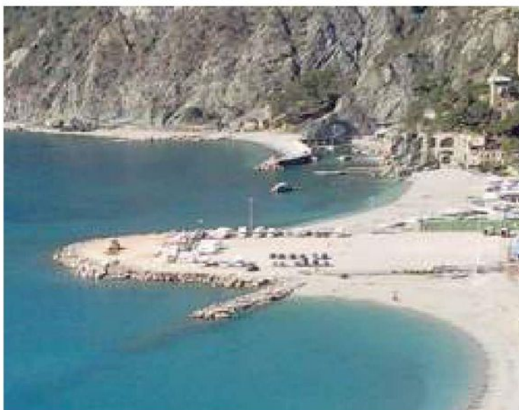
Il parcheggio di Fegina: nuovo accordo con Atc