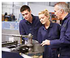
Erasmus+ per le