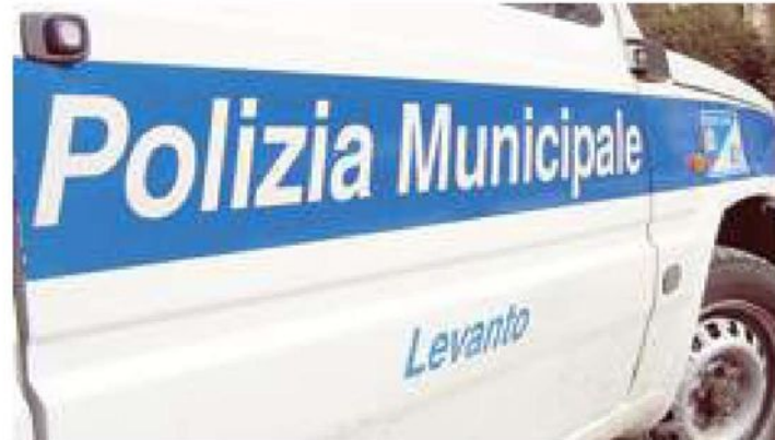
L'autopattuglia della polizia locale di Levanto