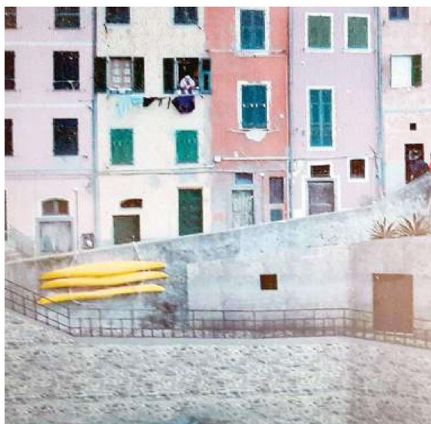
Il rendering su come potrebbe diventare il depuratore di Riomaggiore

«Intervento qualificato come riqualificazione, ma è prodromico a una struttura ex novo»