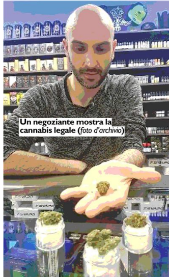
Un negoziante mostra la cannabis legale (foto d'archivio)

Dati utenti del Sert della Spezia relativi al Distretto 18, quindi del Comune capoluogo e da quelli di Lerici e Porto Venere