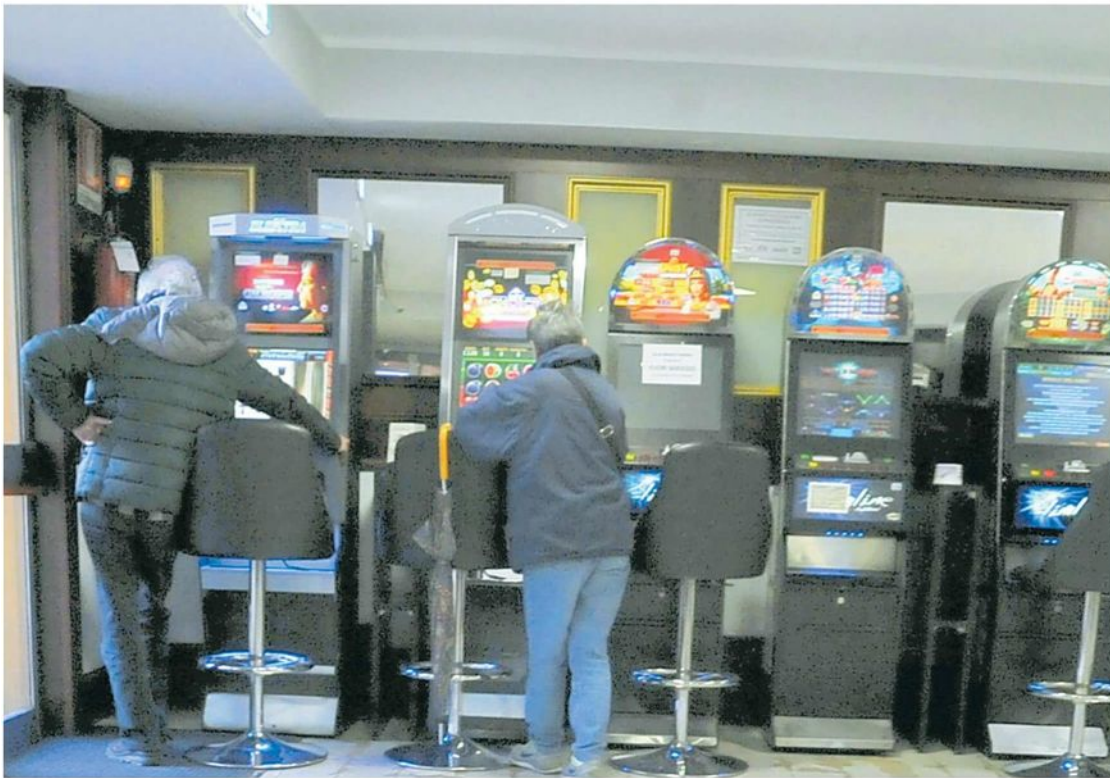
Le slot Sono il sistema più diffuso di gioco d'azzardo e anche il più insidioso

Nel savonese si concentrano i comuni con i livelli più alti di spesa, al secondo posto Vado Ligure