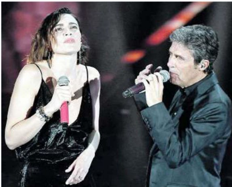
Sopra, il cantautore durante la trasmissione Radio 2 Social Club con Giuliano Sangiorgi