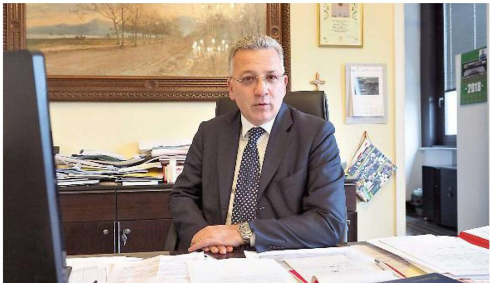
Il sindaco Pierluigi Peracchini nel suo ufficio di Palazzo civico anticipa le linee guida della giunta per il 2019

Spazi adeguati per sviluppare discipline come baseball e rugby, ma anche l'esigenza di intervenire sul fronte delle case popolari per l'emergenza abitativa