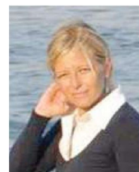
La giornalista Donatella Bianchi