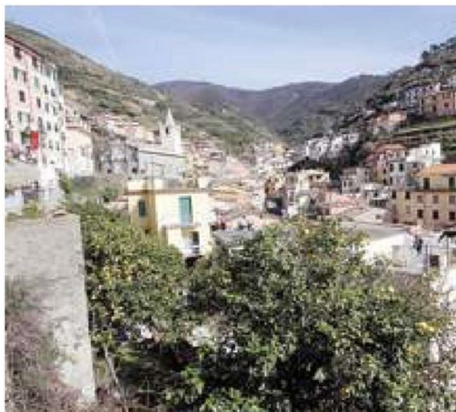
Il borgo di Riomaggiore nelle Cinque Terre