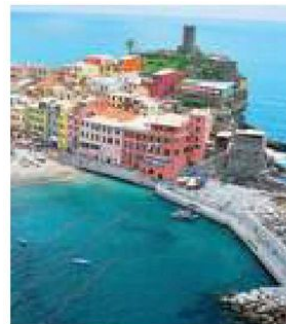
Vernazza, tra i Comuni finanziati