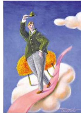
Una delle opere in esposizione

un incarico professionale lo ha portato per tre mesi a Luwingu (Zambia): luogo «di miserie e dignità». La rassegna di febbraio, allo Studio Arte Mosè, già nel titolo, intende far liberare la fantasia, coinvolgere lo spettatore, in una narrazione sospesa, tra le nuvole appunto, dove i protagonisti, giovani innamorati, coppie d'anziani, viaggiatori nel tempo, ballerini, avviano una narrazione di fantasia che è un vero inno all'amore per la vita.