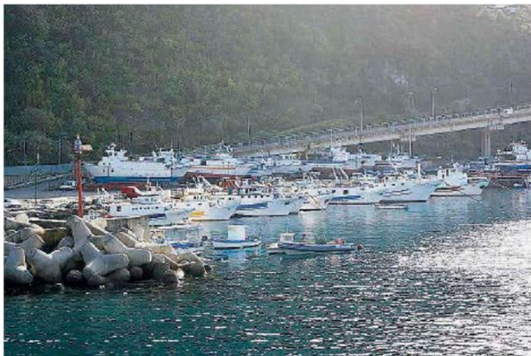
Porto di Bagnara | I pescatori temono i vincoli del Parco marino

Nella Costa Viola potrebbe penalizzare ulteriormente un comparto già in crisi