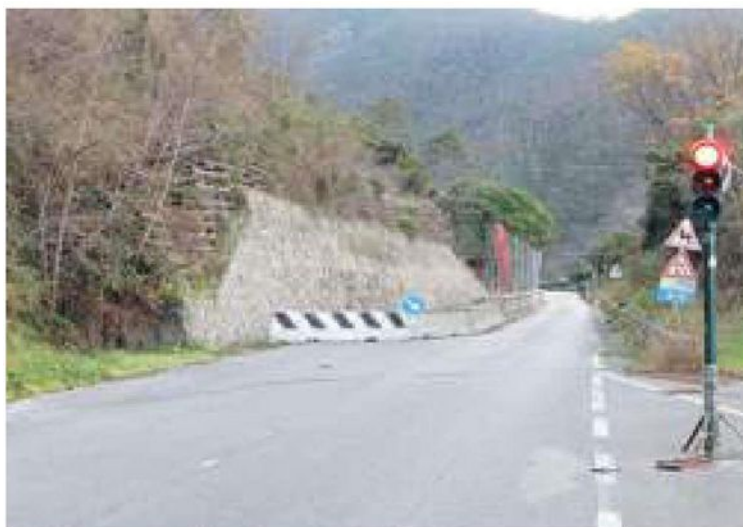
Sulla Litoranea si passa solo a senso unico alternato

La stagione turistica è alle porte così i residenti e gli operatori commerciali chiedono alla Provincia di ultimare i lavori per ripristinare la circolazione e mettere in sicurezza la collina. —