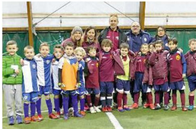
FINALISTI I Piccoli amici 2011 del Follo che hanno vinto il Torneo del Borgo contro l'Arci Pianazze