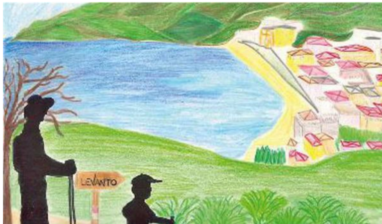
LEVANTO Ottanta chilometri di sentieri, ragnatela di meraviglie