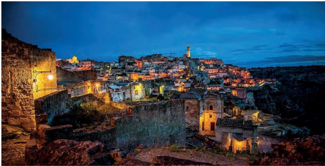
NELLA FOTO IN ALTO: una suggestiva veduta serale dei Sassi di Matera

programmi aggiornati e appuntamenti: http://oradellaterra.org .