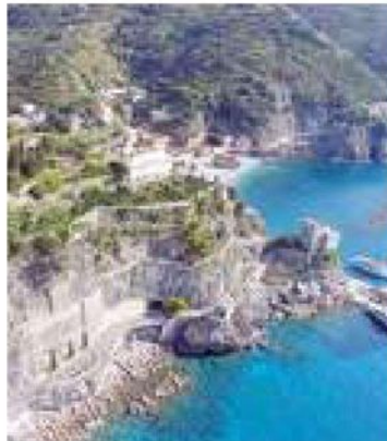
La Cittadella di Monterosso