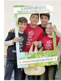
SUCCESSO Si sono già svolti i campionati per le scuole medie

le Cinque Terre. Tanti premi comunque per tutti offerti da ambasciate, uffici del turismo stranieri e dai diversi sponsor.