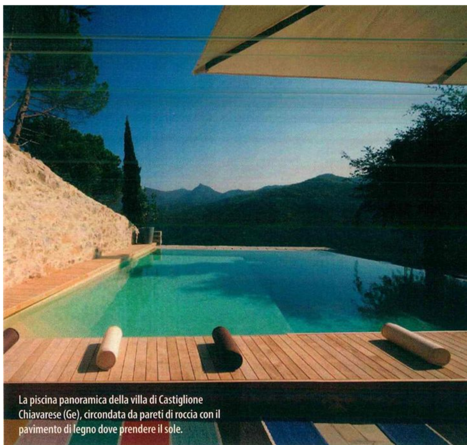
La piscina panoramica della villa di Castiglione Chiavarese (Ge), circondata da pareti di roccia con il pavimento di legno dove prendere il sole.

ottocenteschi colorati, alti e stretti, affacciati sul mare. Dal suo porticciolo partono i traghetti della compagnia Golfo Paradiso per San Fruttuoso, all'interno del parco terrestre e marino del Monte di Portofino, dove si trova la famosa Abbazia che dal 1983 fa parte dei beni architettonici del FAI, e una piccola spiaggetta di ciottoli, in cui fermarsi a noleggiare una sdraio e aspettare il tramonto. ►