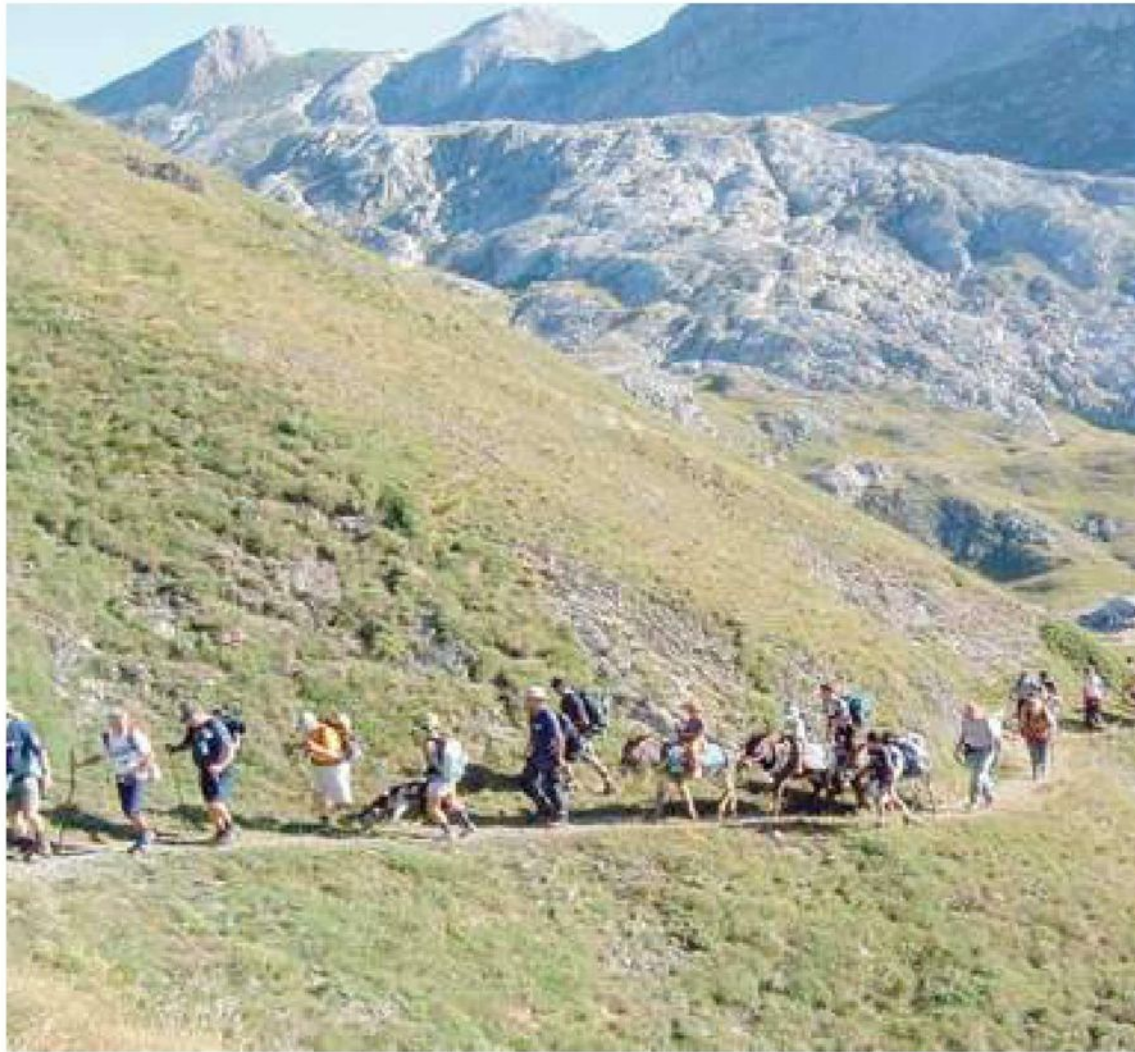
Da oggi al 2 giugno sono previste escursioni anche lungo i sentieri del parco Alpi Liguri