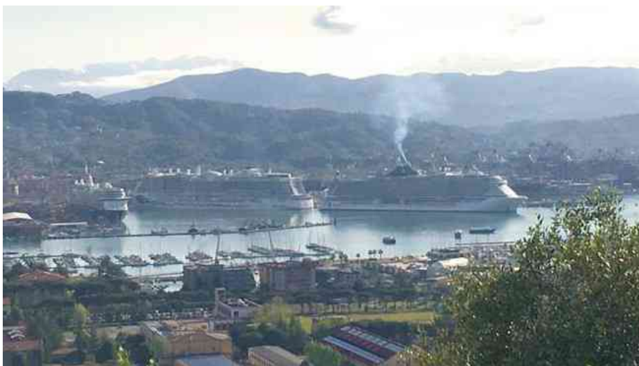
Le tre "love boat" alla Spezia

La Spezia, 7 maggio 2019 - E' una giornata storica per La Spezia , che sottolinea una volta di più l'importanza di questo porto per le crociere. Nella giornata di martedì 7 maggio, infatti, è stato toccato il record di crocieristi sbarcati al terminal di largo Fiorillo: esattamente 14563 passeggeri, numeri che riferisce la pagina Facebook " Crociere La Spezia ".