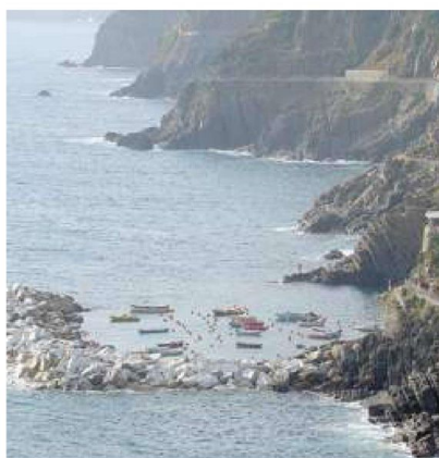
La marina di Riomaggiore danneggiata dalle mareggiate

barche e frequentata dai turisti e bagnanti. Per le opere complessive sulle marine il Comune investirà circa due milioni di euro. Tra i prossimi interventi anche la ristrutturazione del rimessaggio barche sotto la stazione ferroviaria di Riomaggiore. I silos, che ospita circa 20 barche e alcune canoe, sarà riqualificato per ricavare nuovi posti barca. L'obiettivo dell'ente, come già annunciato dal sindaco, è anche quello di dare in affidamento ai privati l'intero silos del rimessaggio. Il progetto e il bando saranno pronti entro fine anno. —