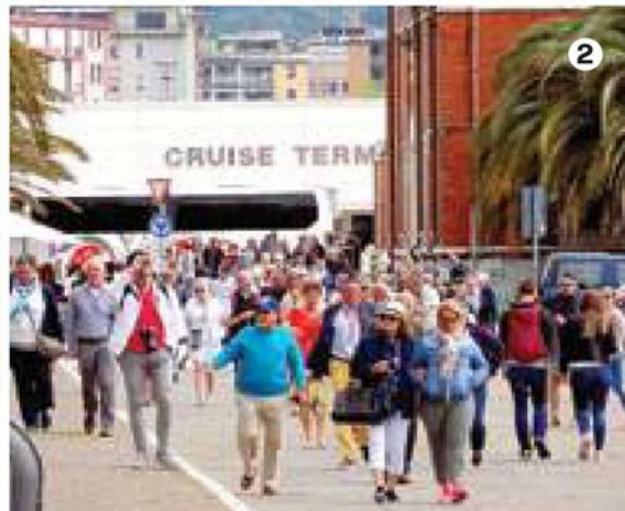
1. L'accosto di ieri delle tre navi da crociera nel porto spezzino, visto da Carrozzo. 2. Il fiume di turisti lascia il Cruise Terminal di largo Fiorillo. 3. Comitive di visitatori ieri in corso Cavour