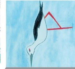
Il cavaliere d'Italia è un uccello di acqua dolce, dimora semplice ed elegante.