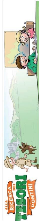
Lavori svolti dagli alunni dell'IC Cencelli di Sabaudia