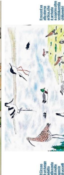
Il record va attribuito all'ardea cinerea, che si registra in un'area di 80 chilometri quadrati.