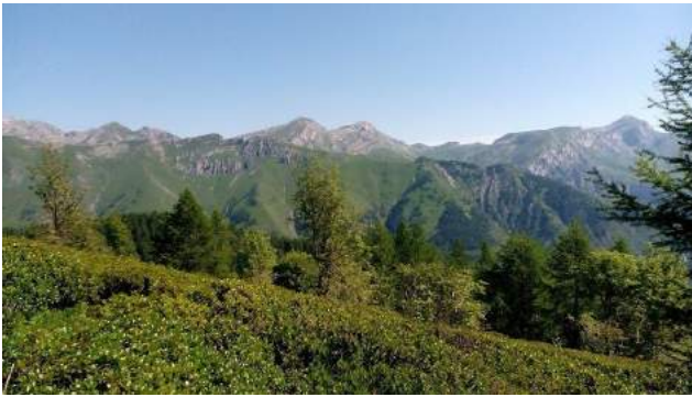
Parco Regionale Alpi Liguri-pendici P.sso Garlenda