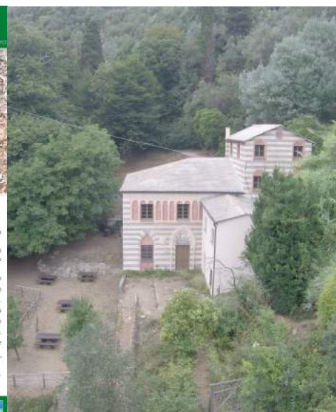
Parco Regionale Portofino