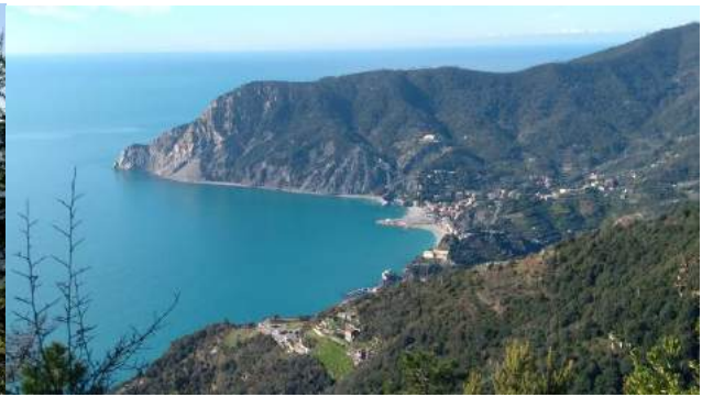
Parco Nazionale 5 Terre-Monterosso