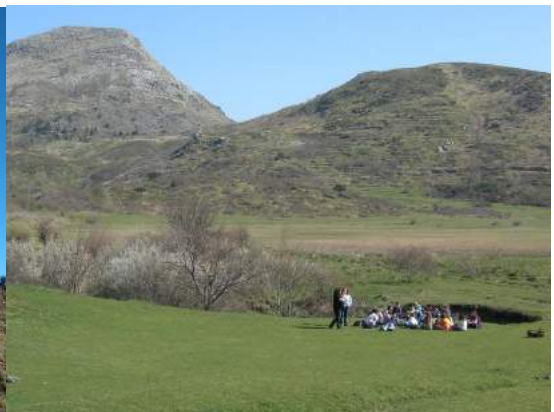
Parco Regionale Aveto - Pian Oneto