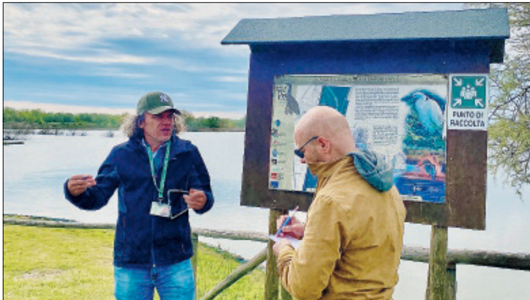
Il Delta è stato oggetto di visite da parte di testate giornalistiche e tv europee

La tv tornerà nei prossimi mesi sul nostro territorio per le riprese che creeranno i contenuti di un documenta-