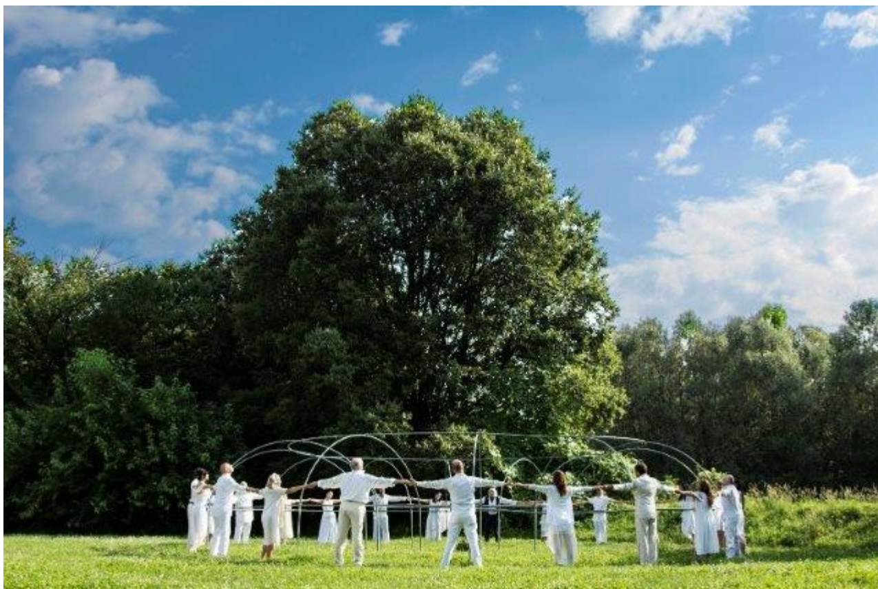
Fotogramma estratto dal film "Poema Circular" del regista Alessandro Avataneo

Informazioni al pubblico: promozione.parcopotorinese@inrete.it , Tel 0114326532