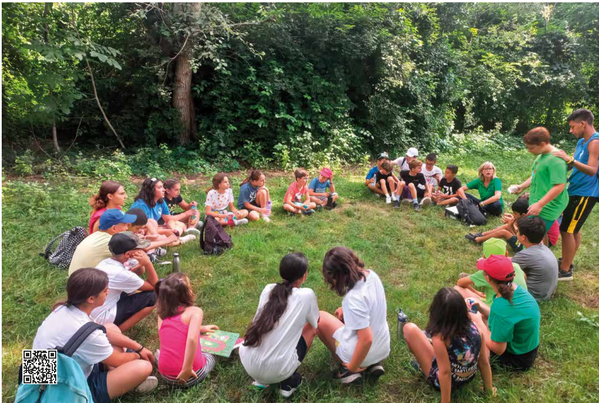
L'Ente di gestione delle Aree protette del Po piemontese propone attività di educazione ambientale rivolte a scuole e a gruppi organizzati. I centri visita forniscono strumenti, stimoli e informazioni per conoscere il territorio e le sue specificità naturalistiche e culturali.