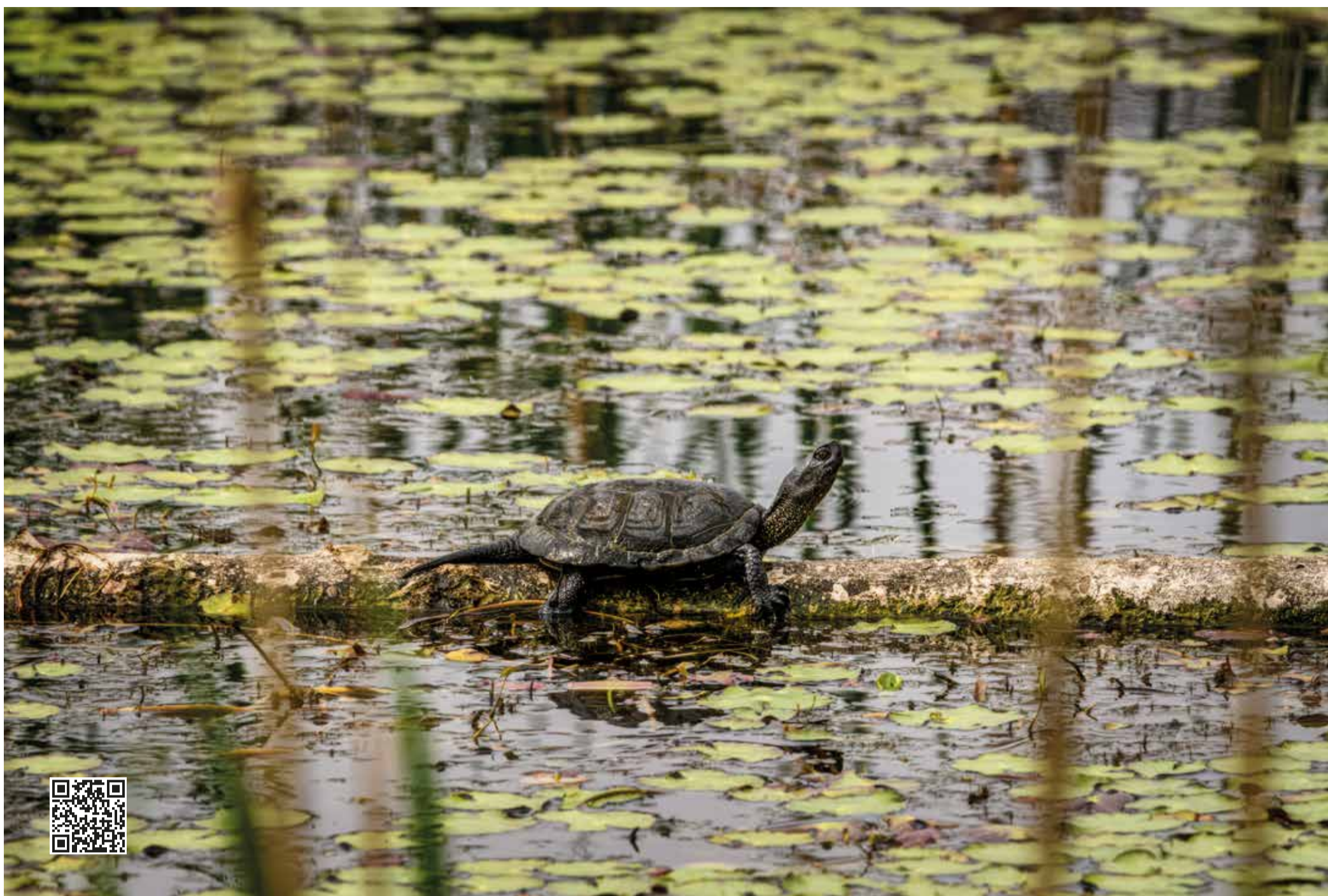
Le Aree protette del Po piemontese sono laboratori di ricerca in cui acquisire informazioni utili per azioni di gestione del territorio, di risanamento, miglioramento e valorizzazione ambientale. Insieme al Centro Emys Piemonte, l'Ente-Parco è attivo nel progetto di reintroduzione della testuggine palustre.